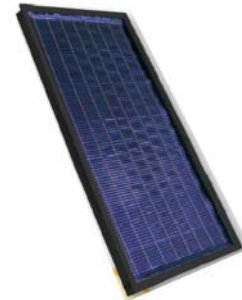
Captador LUMELCO ST-2500

Su principio de funcionamiento es el siguiente: la radiación solar arriba al captador, atraviesa la cubierta transparente e incide en la superficie absorbente. La finalidad de la superficie absorbente es captar la radiación solar y transmitirla en forma de energía térmica al fluido que circula en contacto con ella.